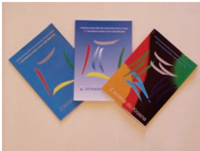
9. Katalogi trzech edycji Międzynarodowego Biennale Artystycznej Tkaniny Lnianej „Z krosna do Krosna”

Organizacja biennale jest niewątpliwie ogromnym wysiłkiem dla tak niewielkiej instytucji miejskiej, jaką jest Muzeum Rzemiosła, tym bardziej, że w tym czasie prowadzona jest dynamicznie działalność oświatowa na temat historii regionu i rzemiosła, organizowane są konkursy, prowadzona jest działalność wydawnicza i naukowa. Środki budżetowe nie wystarczają oczywiście na wszystkie potrzeby, stąd konieczność szukania sponsorów – co dla lokalnych instytucji kultury nie jest wcale łatwe. Dodatkowym, i nie do przecenienia, efektem organizacji biennale w Krośnie jest jednak autentyczna integracja lokalnego środowiska wokół tej imprezy. Krośnieńscy hotelarze gościli bezpłatnie artystów z Ukrainy (7 osób), pozostali uczestnicy otrzymali znaczące rabaty; w galeriach BWA, Krośnień-